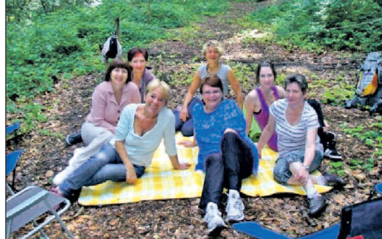
Kleine Pausen während der Bodenübungen mit der Diplom Fitness-Ökonomin waren höchst willkommen.