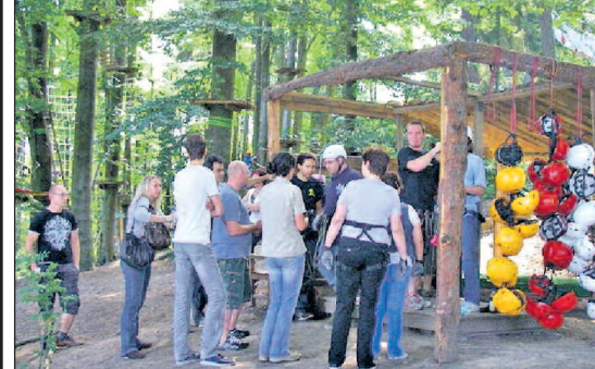
Sicherheitstechnische Einweisung der Klettergruppe.